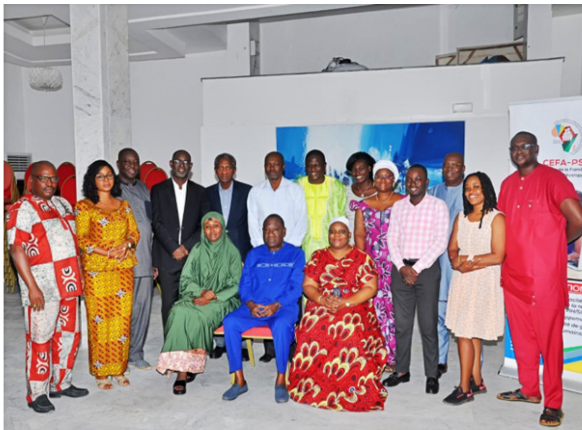
PHOTO DES PARTICIPANT(E)S AU COURS SUR LE LEADERSHIP LE MANAGEMENT ET LA GESTION DES INSTITUTIONS ET DES PROGRAMMES A L'HÔTEL AHOEFA DU 22 AU 26 JUILLET 2024 A LOMÉ