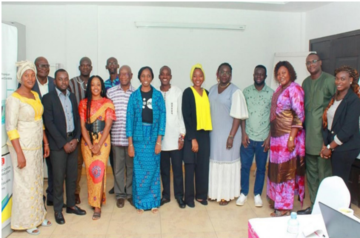
COURS REGIONAL : FORMATION DES FORMATEURS EN TECHNIQUES POUR COMMUNIQUER EFFICACEMENT AVEC LES ADOLESCENTS ET LES JEUNES EN MATIERE DE SANTE SEXUELLE ET REPRODUCTIVE ET VIH/SIDA Période : Du 26 Août au 06 Septembre 2024 / Lieu : BRAVIA ECO HOTEL, Lomé - Togo.