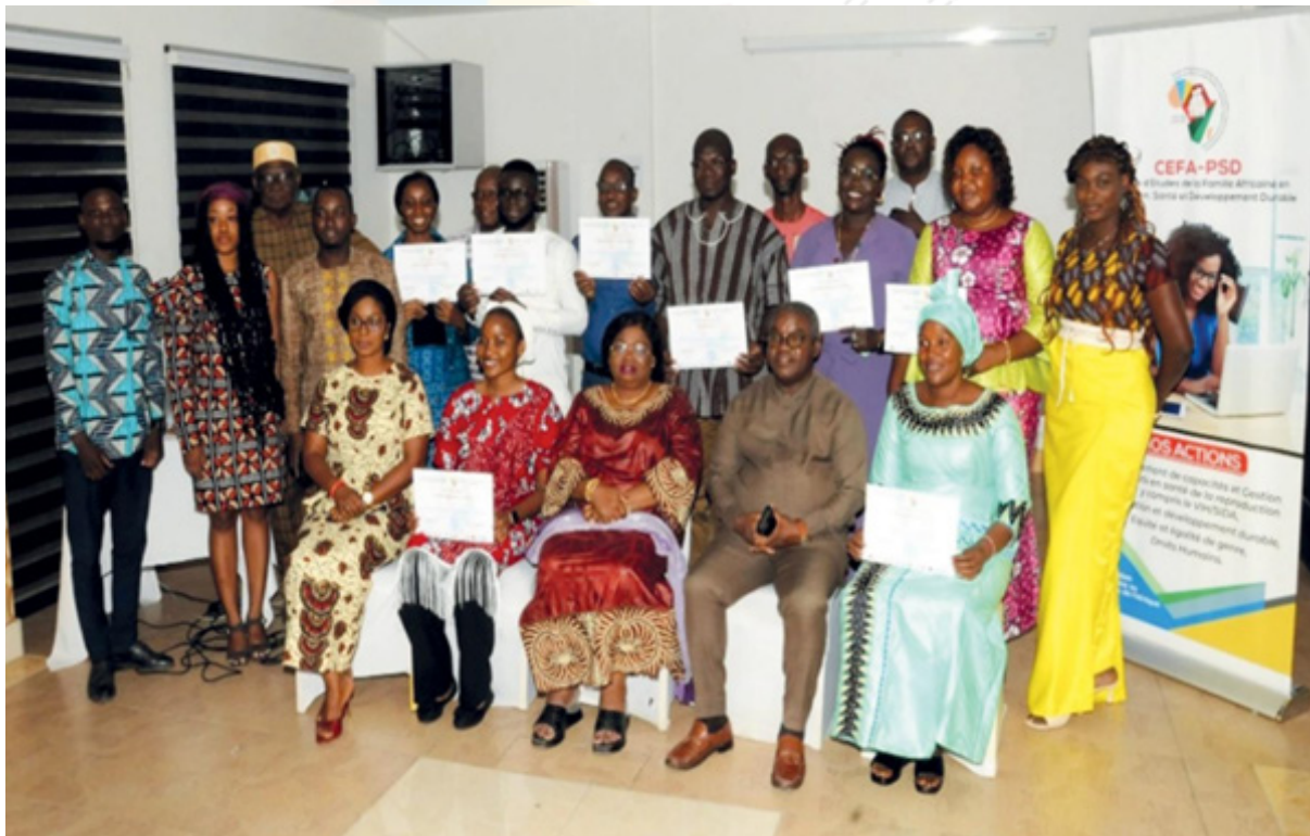
PHOTO DE FAMILLE DES PARTICIPANTS DU COURS RÉGIONAL SUR LA SRAJ A ECO HÔTEL BRAVIA DU 23 OCTOBRE AU 11 NOVEMBRE 2024